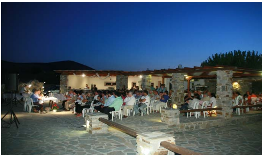
Από την ετήσια εκδήλωση των ΦτΠ τον Αύγουστο 2009 στο Swiss Home Hotel

Στιγμιότυπα από την ετήσια εκδήλωση των ΦτΠ του 2003, 2004 και 2006