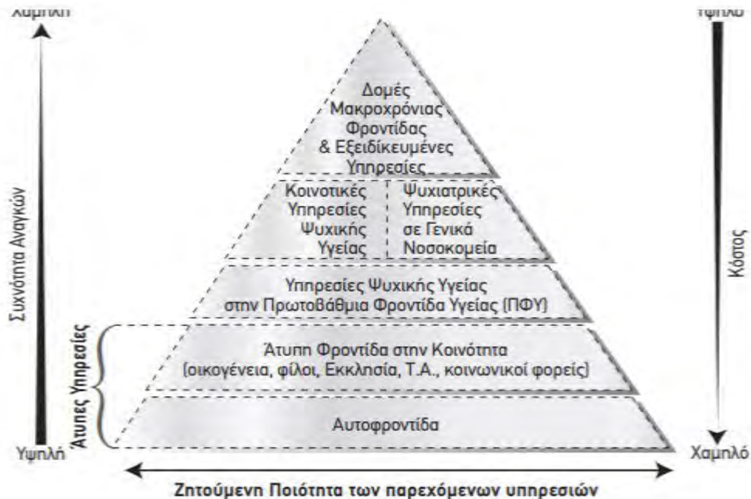
Πυραμίδα του ΠΟΥ (2003) για τη βέλτιστη χρήση και τον συνδυασμό των υπηρεσιών